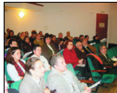
Locutores en reunión 24 de enero